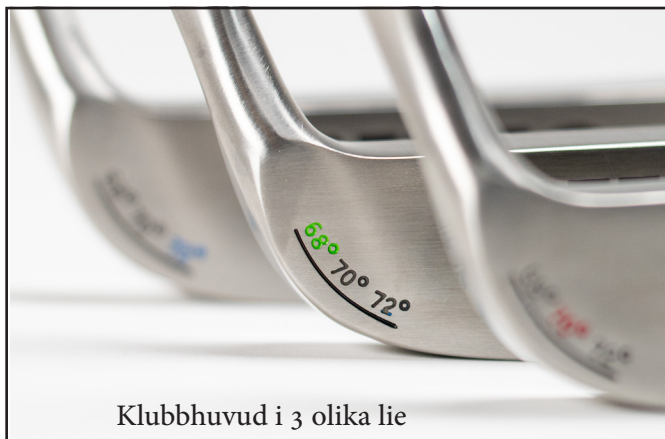
Klubbhuvud i 3 olika lie